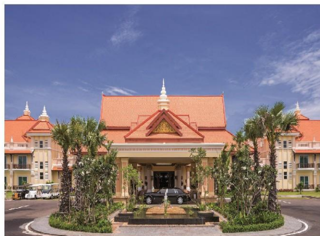
SOKHA RESORT AND CONVENTION CENTER, SIEM REAP

Il padiglione Italiano sarà l'unica presenza europea organizzata da Prometeo che da tre anni coopera con AMB Tarsus Events Group, società malese/inglese con esperienza pluriennale nell'organizzazione di eventi fieristici nella regione del Sud Est Asiatico .